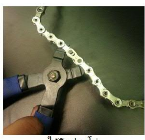
โซ่คีมปลดโซ่